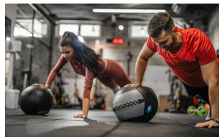
Spezialisierung und Qualifikation für vielseitige Berufsfelder

Der Masterstudiengang bietet Ihnen verschiedene Spezialisierungen, Profilbildungen und Qualifikationen, die den Einstieg in vielseitige Berufsfelder ermöglichen.